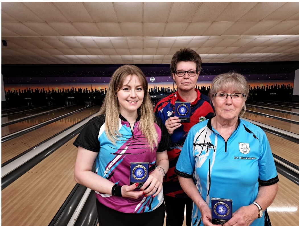
Siegerehrung LM Einzel Damen 2024