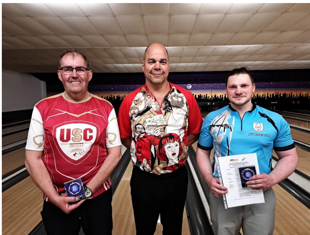
Siegerehrung LM Einzel Herren 2024